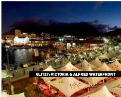
GLITZY: VICTORIA & ALFRED WATERFRONT