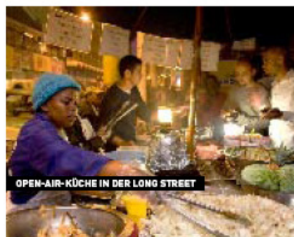
OPEN-AIR-KÜCHE IN DER LONG STREET