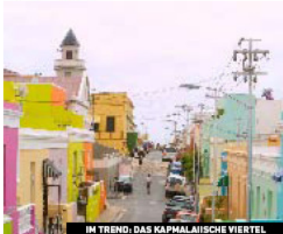
IM TREND: DAS KAPMALAISISCHE VIERTEL