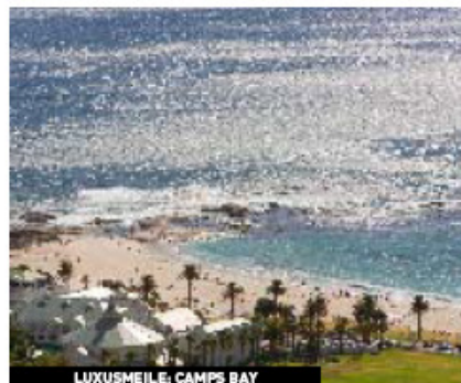
LUXUSMEILE: CAMPS BAY