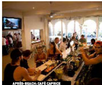
APRÈS-BEACH: CAFÉ CAPRICE