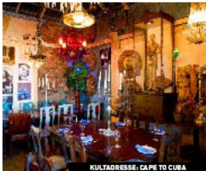
KULTADRESSE: CAPE TO CUBA