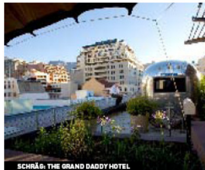
SCHRÄG: THE GRAND DADDY HOTEL